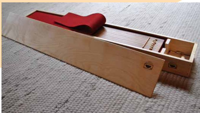
Babymonochord in edlem Holzetui