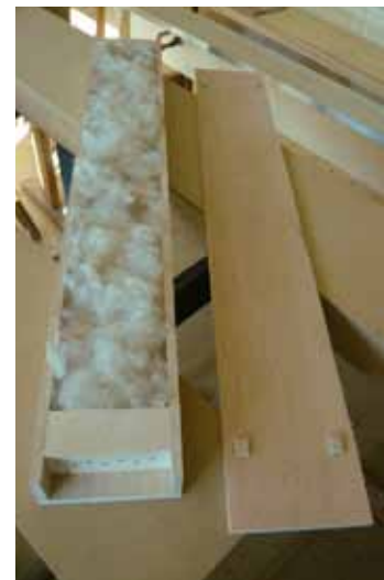
Füllung mit Schafwolle

Das Babymonochord entfaltet seine Qualität vor allem in der direkten Klangerfahrung am Körper. Seine Handlichkeit bei einer großen Schwingungsfähigkeit ist seine größte Stärke. Auch seine Einfachheit in der Form und im Handling sind große Pluspunkte. (So können z. B. auch Ungeübte das Babymonochord durch nur 7 Saiten und Feinstimmer sehr leicht stimmen) Nägel und Wirbel sind im Korpus zurückgesetzt und verdeckt. Das unterstreicht seinen einfachen Ausdruck: Eine einfache, einladende Klangfläche. Ein Klangkörper, den man gerne zu sich nimmt und damit spielt.