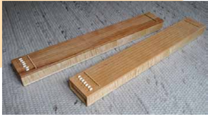
Apfelbabymonochord mit Feinstimmern links, Erlenbabymonochord mit Feinstimmern rechts